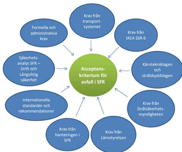
Figur 2-1. Områden från vilka acceptanskriterierna för avfall i SFR härstammar.

Ett av kraven från Strålsäkerhetsmyndigheten är kravet på att den årliga risken för skadeverkningar efter förslutning av förvaret får bli högst 10^{-6} vilket framgår i Strålskyddsmyndighetens föreskrifter om skydd av människors hälsa och miljö vid slutligt omhändertagande av använt kärnbränsle och kärnavfall , SSMFS 2008:37. För att det här kravet ska kunna innehållas behövs en rad acceptanskriterier för avfallet vilka identifieras i säkerhetsanalysen.