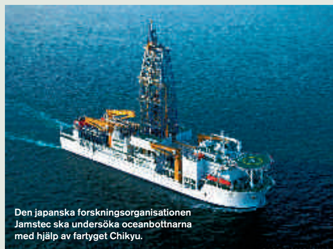
Den japanska forskningsorganisationen Jamstec ska undersöka oceanbottnarna med hjälp av fartyget Chikyu.

Chikyu har redan varit ute på ett par kortare resor för att trimma in utrustning och besättning. Men till hösten bär det av på riktigt. Till en början sker borrningarna vid ett vattendjup på 2 500 meter. På längre sikt är det meningen att utrustningen ska förbättras så att man kan borra även på 4 000 meters djup.