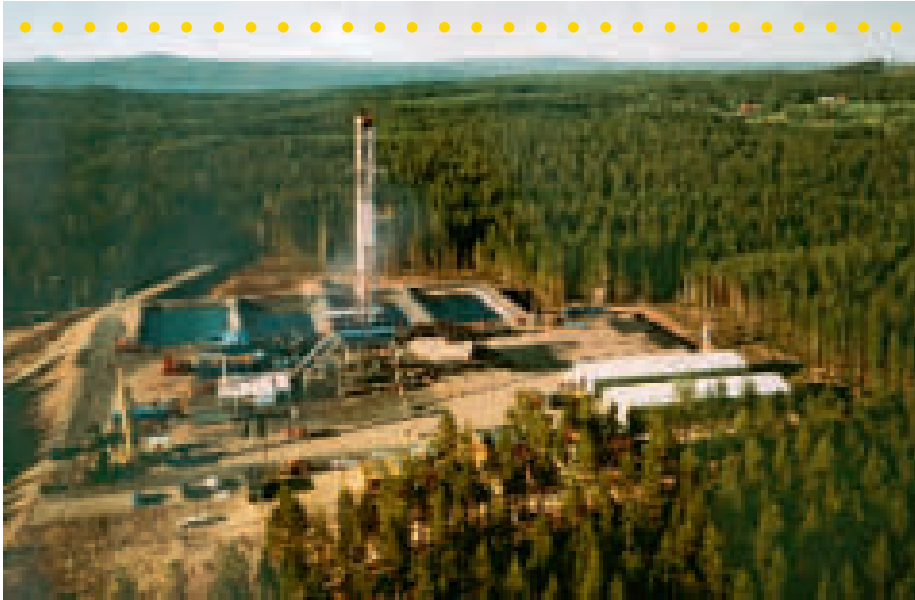
Borrplats Gravberg när det begav sig på 80-talet. Borrigen fick hämtas i USA, den kostade "på rea" tio miljoner.

där man jagade extremt stora borrhigar på USA-marknaden, å andra sidan vetenskaplig forskning och dokumentation som var helt unik för Sverige.