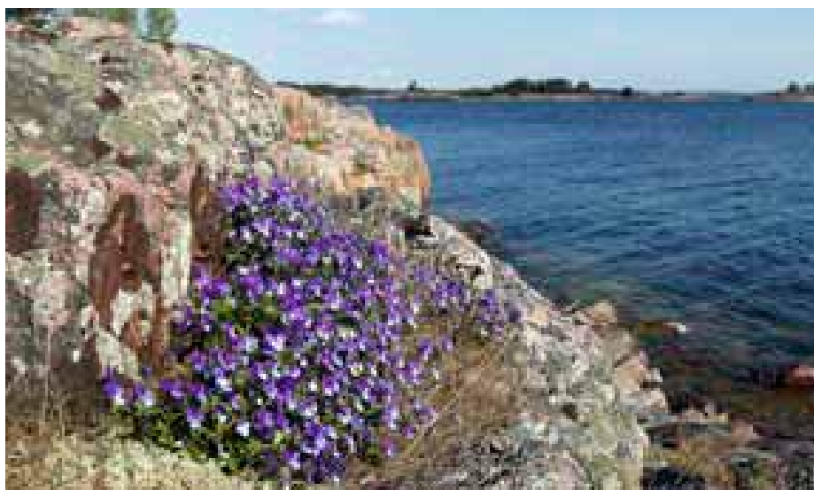
Det finns ett rikt växtliv i skärgården. Här trängs stymorsvioler på en klippavsats.