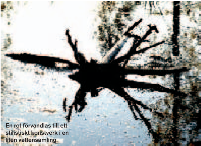
En rot förvandlas till ett stilistiskt konstverk i en liten vattensamling.