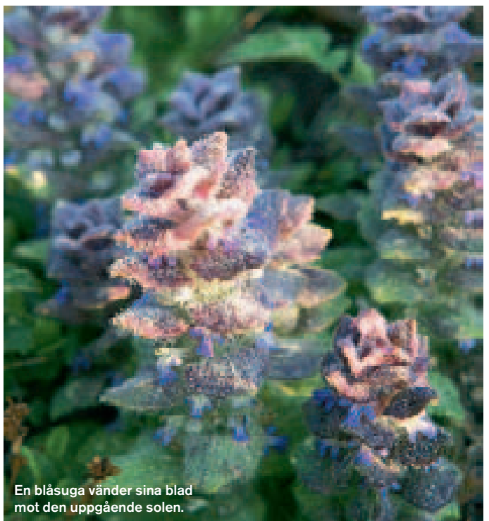
En blåsuga vänder sina blad mot den uppgående solen.

tider och har använts av flera generationer före oss. Enligt gammal tradition lät man korna beta närmast husen, medan oxarna släpptes i hagarna i byns utkanter. Och att det funnits oxar i trakten, det vet man med säkerhet, så en gång i tiden var det här säkert oxarnas egen hage.