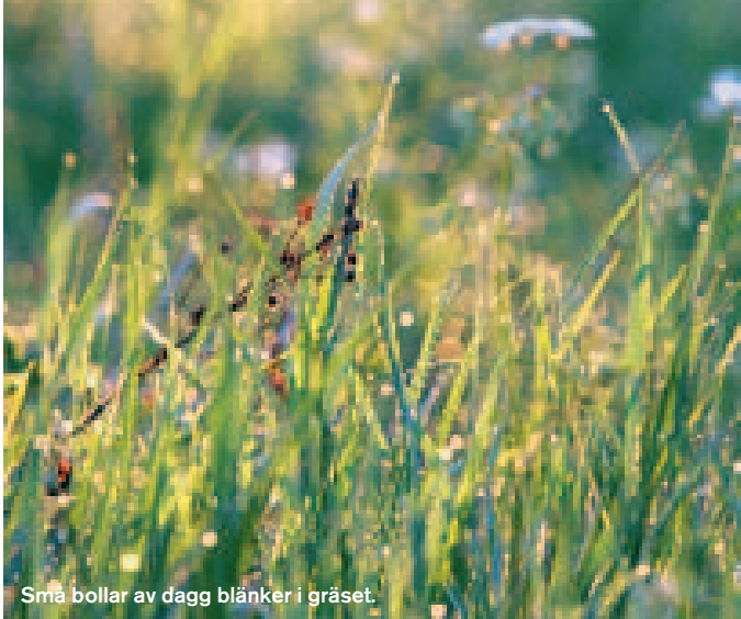
Små bollar av dagg blänker i gräset.