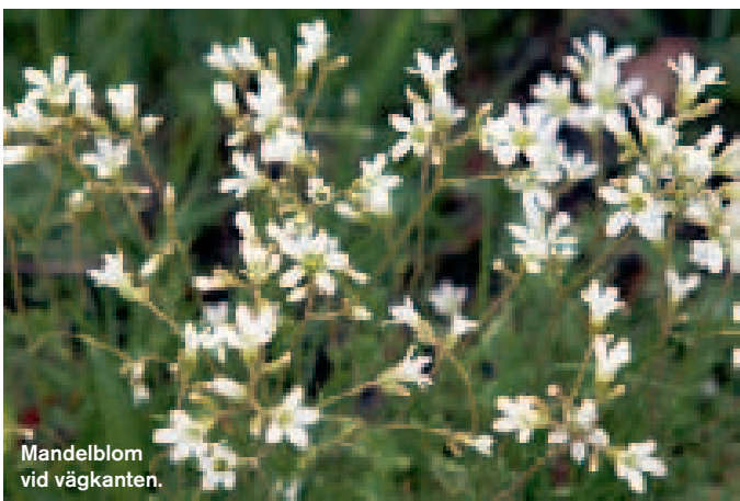
Mandelblom vid väggkanten.