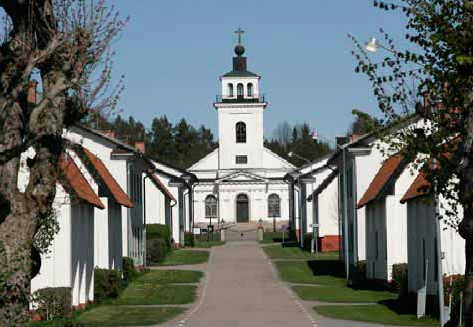
Ett vallonbruk – Forsmarks bruk.